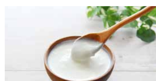
ヨーグルトに 混ぜて