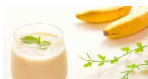
豆乳、バナナと 一緒にミキサーに